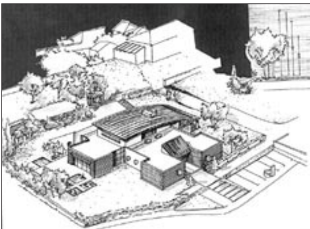
Maison de l'enfance de Rochefort-sur-Loire Esquisse

à des subventions d'Etat, ce qui explique la multiplication de ces équipements suite à des choix politiques tel que les mesures de Ségolène Royal. Le recours à l'architecte se fait souvent trop tard ce qui peut poser des problèmes dans l'élaboration du projet, les délais sont très courts. La Maison de l'Enfance regroupe deux services de nature différente, la crèche qui accueille l'enfant toute la journée tandis que la halte garderie le reçoit quelques heures dans la semaine. Certaines maisons ouvrent aussi des espaces aux assistantes maternelles qui gardent des enfants à domicile, ce sont des lieux de rencontres, d'échanges et de formation. C'est le cas à Mûrs-Erigné.