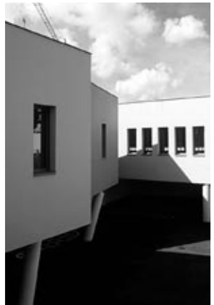
Groupe scolaire du bois de Mollières à Angers. FORMA 6, architectes

Jusqu'aux années 90, la construction scolaire retrouve un certain essor. Les créations d'écoles sont essentiellement localisées dans les secteurs de forte rénovation et dans les Z.A.C. D'importants travaux de réhabilitation et de réaménagement enrichissent les établissements de classes supplémentaires et d'équipements nouveaux. Le mot d'ordre est « changer pour demeurer ». Apparaissent les concepts de C.D.I. (Centre de Documentation et d'Information) de salle polyvalente ou de motricité, etc... La politique de décentralisation insufflé une nouvelle dynamique et marque un tournant décisif dans la répartition des compétences. Tout ce qui a trait à l'architecture est délégué et les applications ministérielles n'ont plus qu'une valeur de conseil. Aux années de normalisation succèdent les années de diversité. Les écoles au visage uniforme de l'après-guerre cèdent la place à des écoles singulières composant un paysage éclectique. Elle est marquée par la diversité de