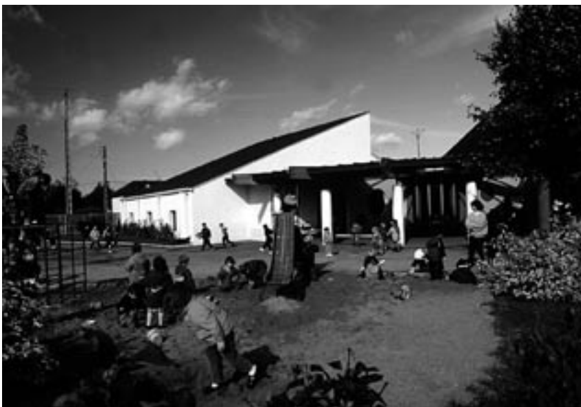
Groupe scolaire de Brain-sur-l'Authion, A & P de Coquereumont et H. Lebreton, architectes

L'école est un lieu essentiel de socialisation pour l'enfant. Parents, enseignants, concepteurs et maîtres d'ouvrage doivent lui offrir les moyens de s'approprier cet espace .... Plus la liberté d'appropriation est grande, mieux l'usager vit le lieu où il évolue : il en est l'acteur, il peut agir sur lui. C'est dans ce sens que de nombreuses initiatives sont nées : sensibiliser, informer, stimuler, insuffler un esprit de participation. Tels sont les objectifs visés par les intervenants auprès des élèves : éducateurs et professionnels extérieurs (CAUE et autres). Ces expériences ont toutes comme point de départ le vécu de l'enfant. Les efforts conjugués des différents intervenants devraient permettre que les domaines de l'architecture, de l'urbanisme et plus largement de l'environnement soient enfin pris en compte par le milieu scolaire. Le futur citoyen ainsi formé devrait être en mesure de comprendre son cadre de vie, de le critiquer et d'exprimer son avis. Plus exigeant, il sera demandeur et acteur d'un environnement de qualité. ■