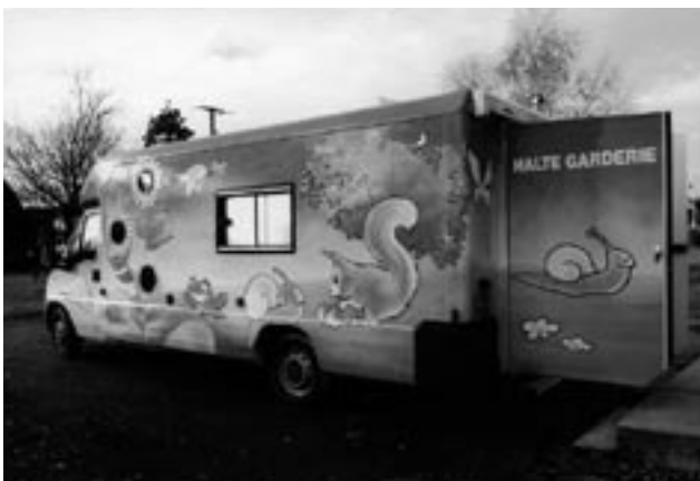
L'escargole, garderie itinérante

AM < Le bilan intercommunal est réussi puisque la fréquentation de la halte-garderie itinérante montre que les familles font jouer l'intercommunalité ; les enfants venant de communes différentes sont gardés dans une autre. Les familles se déplacent et utilisent le service en fonction de leurs besoins dans la semaine, pas nécessairement en fonction du lieu où est la garderie. De plus l'équipe de pro- ➔