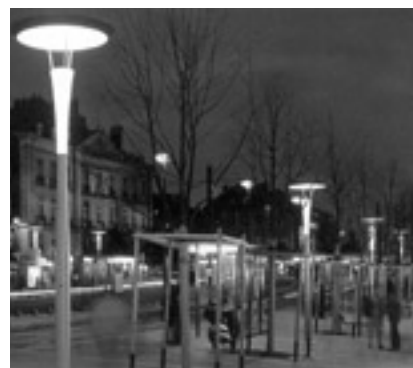
Cours des Cinquante Otages à Nantes. Conception lumière : Roger Narboni.