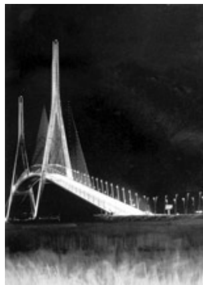
Le pont de Normandie. Conception lumière : Yann Kersalé.

constamment pour mettre sur le marché de nouvelles sources avec une tendance à la miniaturisation. Cela permet de répondre tant en termes de flux lumineux que de température de couleur à toutes les ambiances souhaitées dans le meilleur rapport puissance consommée/quantité de lumière. Enfin, l'efficacité d'une installation dépend également de la régularité de la maintenance : contrôle des lampes, nettoyage du luminaire... La durée de vie et le coût de maintenance d'une installation dépendent de cette vigilance. ■