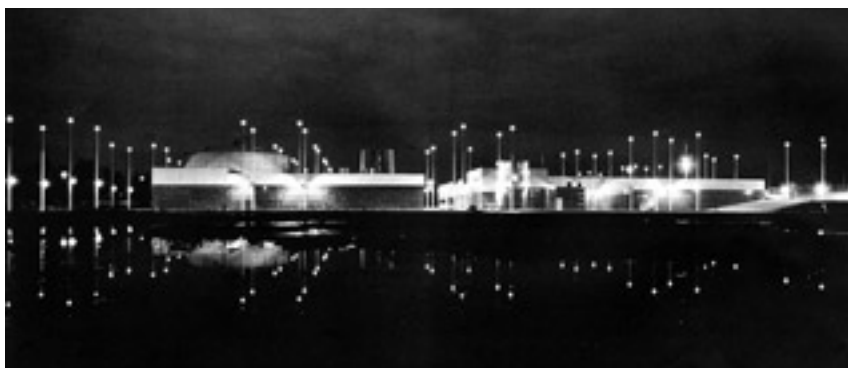
Clos de Hilde, station d'épuration, Bègles. Conception lumière : Jean de Giacinto.

Prise isolément dans une de ces fonctions ou dans la transversalité de celles-ci, la lumière peut être utilisée dans tous les types de situations : en amont d'un projet où elle participe directement à la conception même de l'opération, dans le cadre d'une restauration architecturale ou une restructuration de site où elle renforce le parti pris du projet et l'identité du lieu, dans les réflexions d'aménagement urbain à travers la réalisation de plans lumière ou de schémas directeurs lumière qui associent généralement l'ensemble des fonctions attendues : sécurité, balisage, identité, attractivité, valorisation... Alors pour la qualité de notre cadre de vie, que la lumière soit... ■