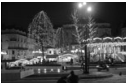
Place du Ralliement, Angers.

Et puis l'électricité vint ; « elle est le progrès, la poésie des humbles et des riches ; elle prodigue l'illumination ; elle est le grand Signal » déclamaient le jeune Paul Morand, émerveillé, devant le Palais de l'électricité de l'exposition universelle de 1900. Alors la lumière, peu à peu, dessine et construit la ville ou marque le paysage comme ces autoroutes du nord de l'Europe qui égrainent en points lumineux le temps qui passe. C'est la ville américaine où l'être s'efface derrière le néon. « C'est beau, une ville, la nuit » comme dernier message d'un omniprésent artifice. La lumière comme symbole, abondance et compétition.