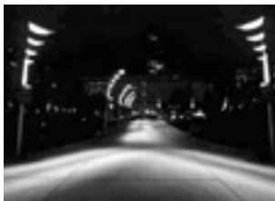
Jardin de l'Atlantique, Paris.

LC < Ce sont aussi des commandes publiques sur concours. A l'étranger, en tant que français, nous bénéficions d'une plus-value ; la french touch qui est réelle d'ailleurs séduit les maîtres d'ouvrage étrangers. En France, vous êtes trop cher de 5 %, on vous vire.