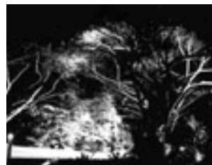
Istana Park, Singapour.

Généralement ces lieux sont les jardins et les bords de rivière. Ces derniers sont nécessairement ouverts au public. Mais les jardins en France sont fermés le soir. C'est dommage car ils créent des zones complètement noires dans de nombreuses villes. Je réalise en revanche de nombreux éclairages de jardins en Asie. En éclairant les ramures des arbres, on chasse l'oppression de la nuit. Je me bats pour éclairer les feuilles des arbres à Paris. J'ai réussi deux grandes avenues intégrant l'éclairage de la voûte des arbres en France, l'une à Aix-en-Provence réceptivée récemment et la N 6 il y a deux ans.