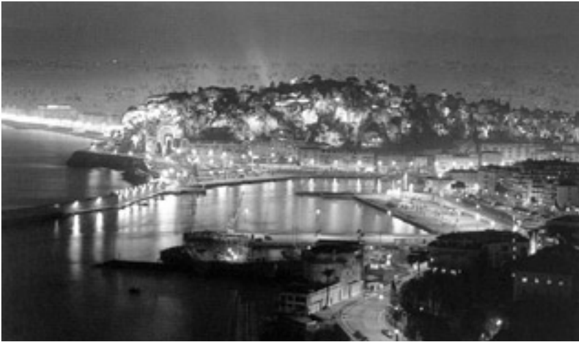
Colline de Nice. Conception lumière : Alain GUILHOT.

D'abord il y eut l'apport de la lumière dans l'espace public, sécuritaire avant l'heure, braseros phosphorescents à l'entrée des cavernes, torches le long des rues et becs de gaz au coin des boulevards ou à l'annonce d'une auberge, aux abords d'un village. La lanterne rouge comme premier signe d'un vocabulaire urbain naissant et dont la prolifique diffusion va en un siècle dessiner la ville lumière.